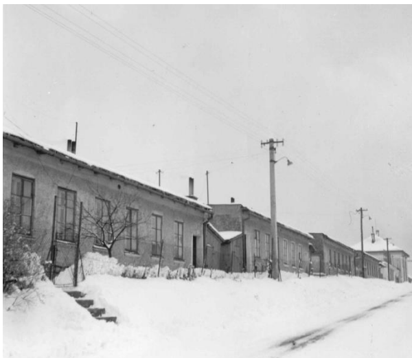
Domky vystavěné pro zaměstnance na ulici Křtěnovská

V roce 1963 byla na poli proti továrně zbudována i mateřská školka pro děti zaměstnanců se čtyřmi učebnami a s kapacitou až 60 dětí. V sousedství továrny bylo také v letech 1962 až 1963 vystavěno 8 domků pro zaměstnance.