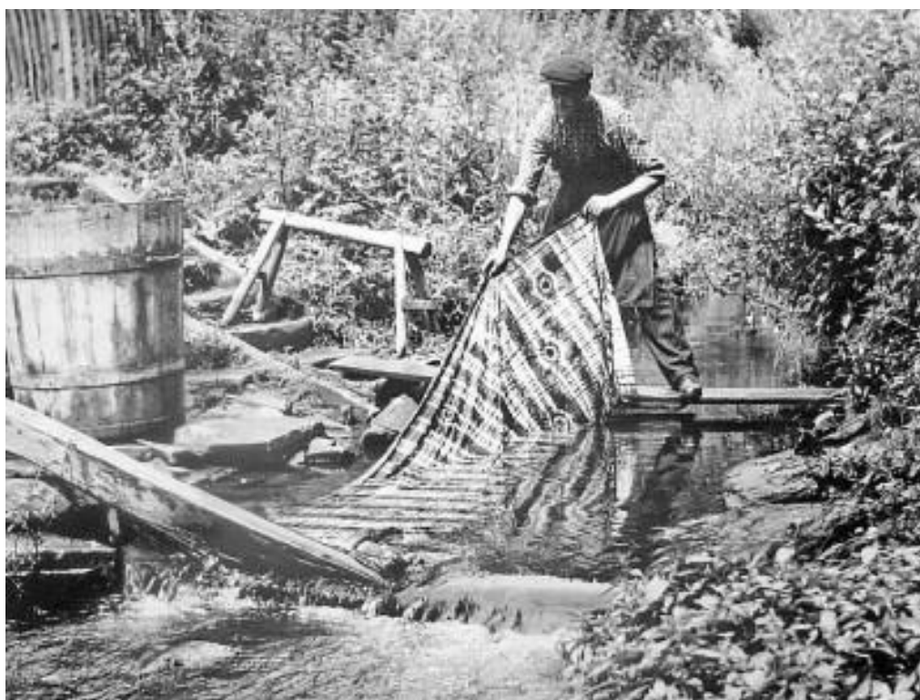
Praní na potoce

Výroba modrotisku spočívá v ručním tisku vzorů odpuzující hmotou na plátno a jeho následné obarvení v přírodním modrém barvivu zvaném indigo. Je to první cílevědomá technika zdobení textilu (tzn., že již před barvením zná barvív výsledek). Původně se k barvení používal len, který se v kraji pěstoval a zpracovával, později jej nahradila bavlna. Technika zdobení spočívá v nanesení tiskařské hmoty, papu (hmoty podobné vosku) pomocí forem z hruškového nebo švestkového dřeva na plátno (jako razítkem) a jeho následném obarvení. K barvení se používá indigo, barva rostlinného původu. V místě, kde byla nanesena tiskařská rezerva se barva nedostane k vláknu. Po dobu několika hodin je látka v potřebných intervalech nořena do tzv. kypy, dva metry hluboké kádě zapuštěné do země, s lázni z indiga. Po vyjmutí se látka namočí do kyselého roztoku, který rozpustí tiskařskou rezervu a zároveň ustálí indigo. Látka je po uschnutí vymandlována, čímž se docílí hladkého a lesklého vzhledu modrotisku.