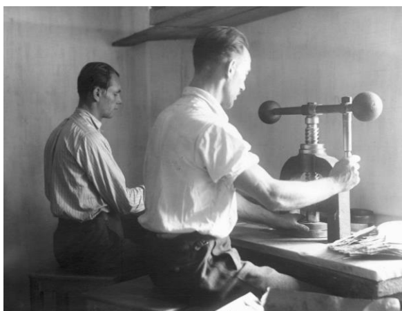
Dělníci při práci na strojích v roce 1939 ...

Jedná se o rukodělnou výrobu, která vyžaduje velkou zručnost a cit pro výrobu květin. Většina strojů, které se v Moraviafloru používají, jsou stejné po celou dobu fungování firmy.