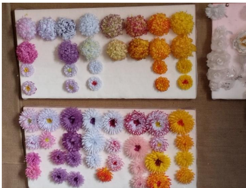
Květiny vyrobené z papíru

Vysekávacím strojem se z papíru vysekne tvar dané květiny. Poté se papír prokropí lihem a vodou. Nakropené výseky se nechají několik dní proležet. Nadále se výsek probarvuje různými barvami dle přání zákazníka. Po odležení a dostatečném usušení se dále zpracovává na stroji. Jedním z těchto strojů je tzv. karusel , který tvaruje plátek květin teplem a tlakem. Po vylisování vzniknou takzvané pompony nebo jiřiny. Poté se na lisu sešijí plátky a vznikne květina. Pro delší životnost se dále papírové květiny voskují. Druhou možností ve způsobu výroby je stroj zvaný rýfkovačka tvarující květiny velkým tlakem. Po vylisování vzniknou takzvané chryzanty. Po navlečení se také voskují.