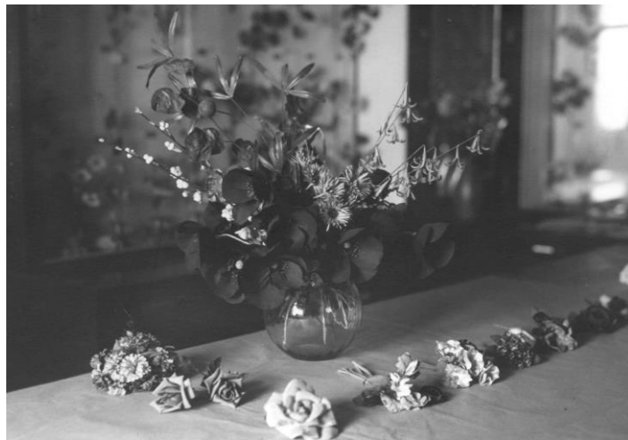
Výrobky firmy (kolem roku 1939)