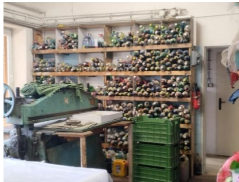
Police s barvami k barvení látek