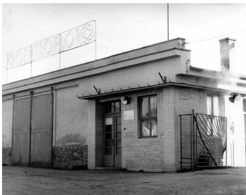
Centroflor v 60. letech 20. století

Již v roce 1948 byl podnik znárodněn a začleněn do komplexu podniků pod společným názvem Centroflor se sídlem v Dolní Poustevně. Bývalý Matonohův podnik měl v té době 200 zaměstnanců včetně domácích pracovnic a měl již značné obchodní styky v tuzemsku i v zahraničí. Podnik dále rozšiřoval výrobu v podvýrobách (např. v Bystrém), počet zaměstnanců dosáhl až na 560 lidí, po znárodnění si podnik ponechal i externí spolupracovníky, kteří si vyzvedávali připravený materiál, výrobky doma dokončovali a hotové je odevzdávali v podniku.