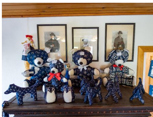
Výrobky z MODROTISKU