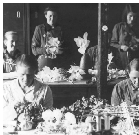
Dělnice ve výrobě v roce 1939

Již v roce 1948 byl podnik znárodněn a začleněn do komplexu podniků pod společným názvem Centroflor se sídlem v Dolní Poustevně. Bývalý Matonohův podnik měl v té době 200 zaměstnanců včetně domácích pracovnic a měl již značné obchodní styky v tuzemsku i v zahraničí. Podnik dále rozšiřoval výrobu v podvýrobách (např. v Bystrém), počet zaměstnanců dosáhl až na 560 lidí, po znárodnění si podnik ponechal i externí spolupracovníky, kteří si vyzvedávali připravený materiál, výrobky doma dokončovali a hotové je odevzdávali v podniku.