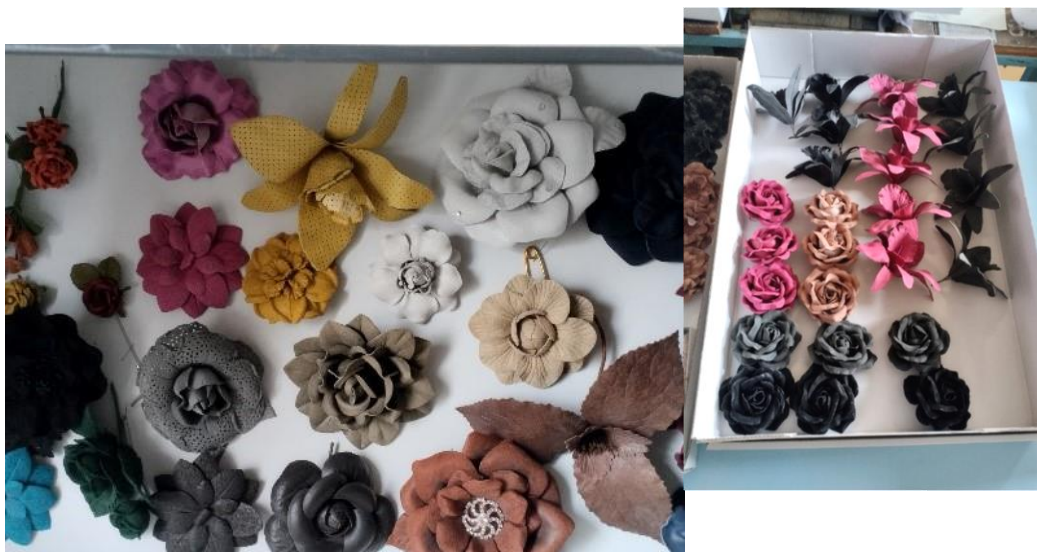
Květiny vyrobené z kůže a textilu

V Moraviafloru se všechny květiny vyrábí pouze z přírodních materiálů - bavlna, len, hedvábí samet, vlna, viskóza, kůže, juta. Materiál se naškrobí želatinou, aby držel tvar květiny. Vyseká se daný tvar a dle přání zákazníka se obarví a nechá se uschnout. K barvení se používají pouze ekologická tuzemská barviva. Poté se lisem vylisuje tvar dané květiny a vyváže se do různých vývazků.